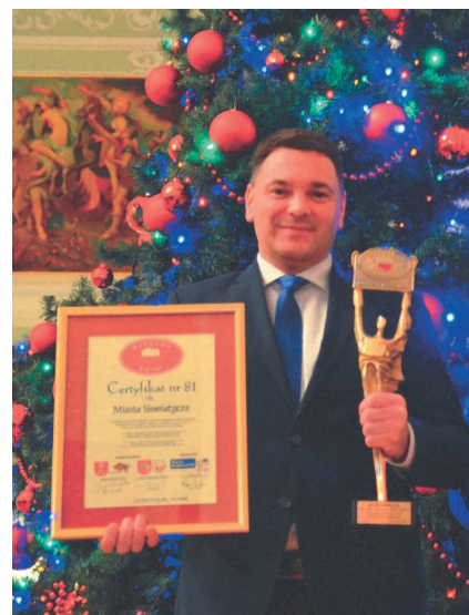
2018 rok - Laureat Krajowej Nagrody Ekologicznej "EKOJANOSIK - Zielona Wstęga Polski", wyróżnienie Krajowej Rady Ekologicznej przy współudziale m.in. Narodowego Funduszu Ochrony Środowiska i Gospodarki Wodnej oraz Związku Miast Polskich.